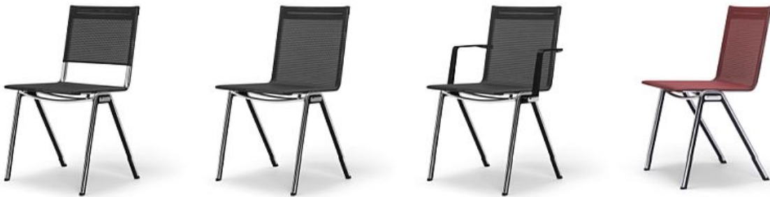
verschiedene Gestaltungsvarianten eines Produkts: Design 1, Design 2, Design 3, Design 4, auch als Sammelanmeldung möglich

Mehrere Gestaltungsvarianten eines Produkts (zum Beispiel unterschiedliche Farben und Formen) dürfen Sie nicht als ein einziges Design einreichen. Um verschiedene Variationen eines Produktes schützen zu lassen, müssen Sie jede Gestaltungsvariante als eigenes Design anmelden; möglich ist dafür auch eine Sammelanmeldung :